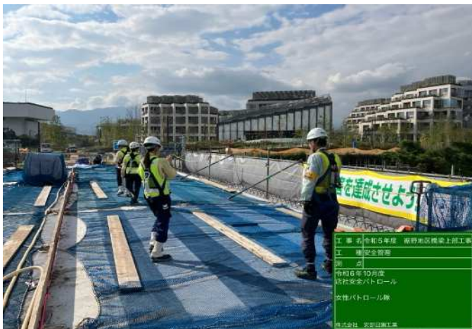
工事名 令和5年度 豊野地区橋梁上部工事 工種 安全管理 期 点 令和6年10月度 当社安全パトロール 女性パトロール隊 株式会社 安部日鋼工業