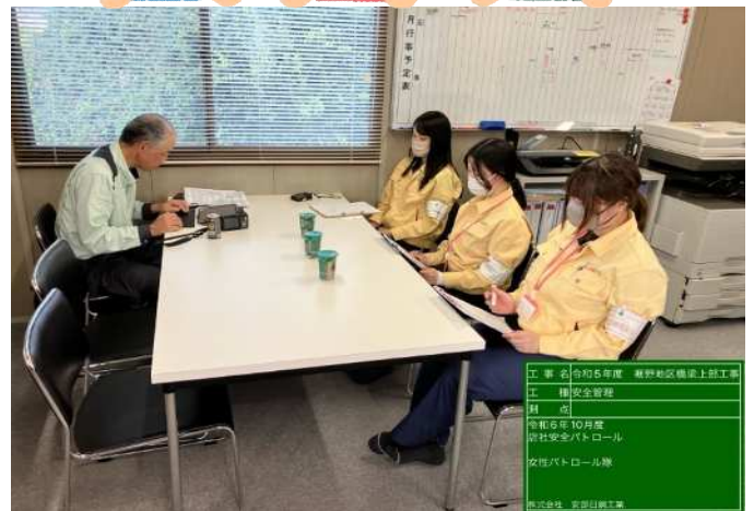
工事名 令和5年度 豊野地区橋梁上部工事 工種 安全管理 期 点 令和6年10月度 当社安全パトロール 女性パトロール隊 株式会社 安部日鋼工業

お忙しい中ご対応いただき、ありがとうございました！ 作業員さんへの声かけが多く、風通しの良い職場環境が出来ていました。